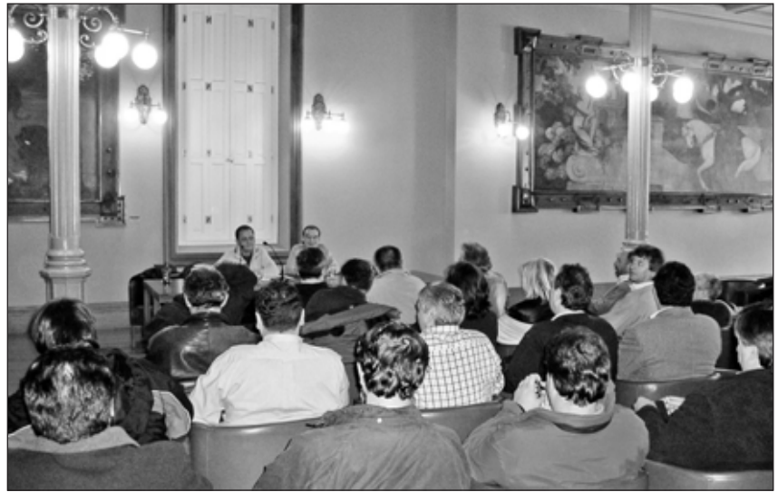
Asemblea da Sección Sindical da CIG en Caixa Galicia.

Nese ano, a CIG convocou asembleas de apoderados e apoderadas por toda Galiza, así como unha recollida de sinaturas solicitando a actua-