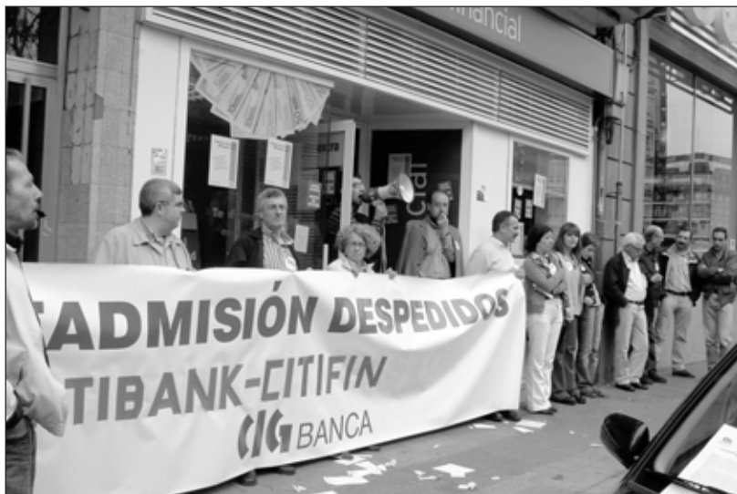
Concentración do día 9 de maio diante da oficina de Citifinancial en A Coruña.

u Estaríamos así ante unha agresiva reestruturación de persoal, destruindo postos de traballo mediante despedimentos fraudulentos por motivos "disciplinarios".