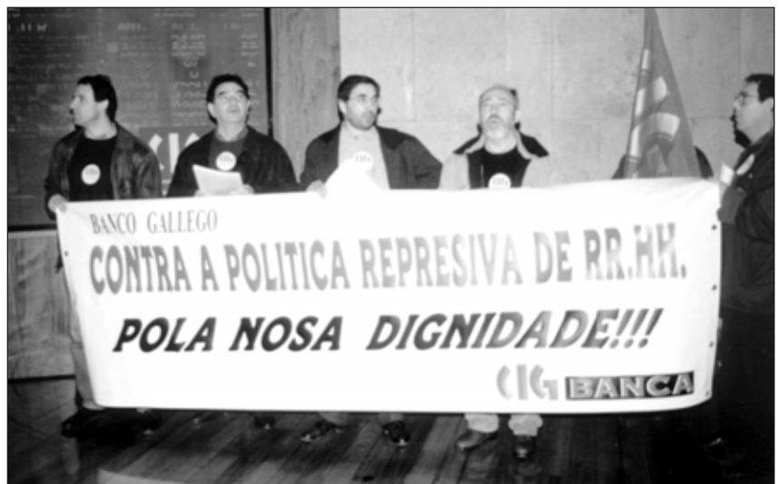
Protesta da Sección Sindical da CIG contra a política de Recursos Humanos do Banco Gallego.

No prazo dun mes, a Dirección do banco vai poñerse en contacto coas