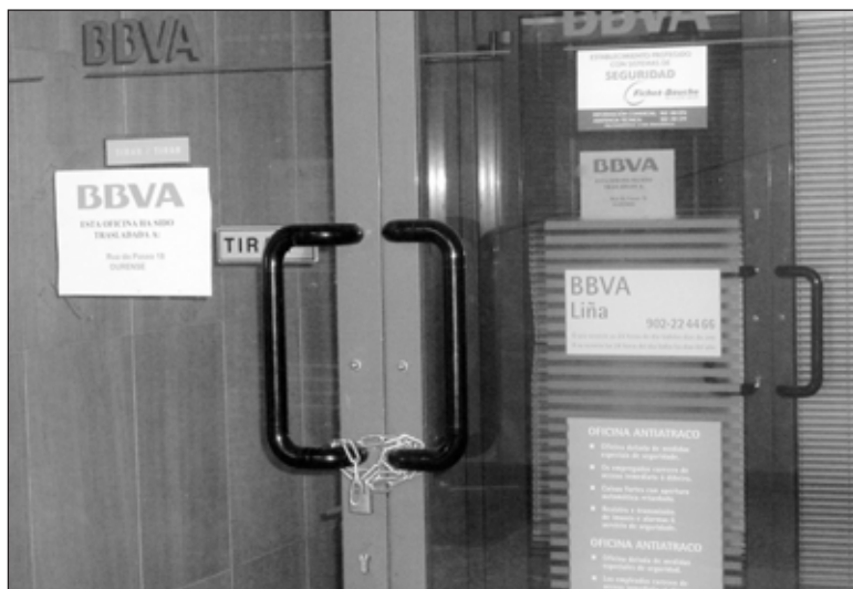
Xa as fusións bancarias levaron ao peche de centos de oficinas.

Agora a crise está afectando ao sector financeiro que está a pechar oficinas. A escasa rendibilidade fai que moitas oficinas bancarias do rural estean abocadas a pechar as súas portas a curto e medio prazo. O negocio bancario neses pobos quedou reducido ás pensións, ás contas de prazo dos pensionistas e ás cada vez menores remesas da emigración.