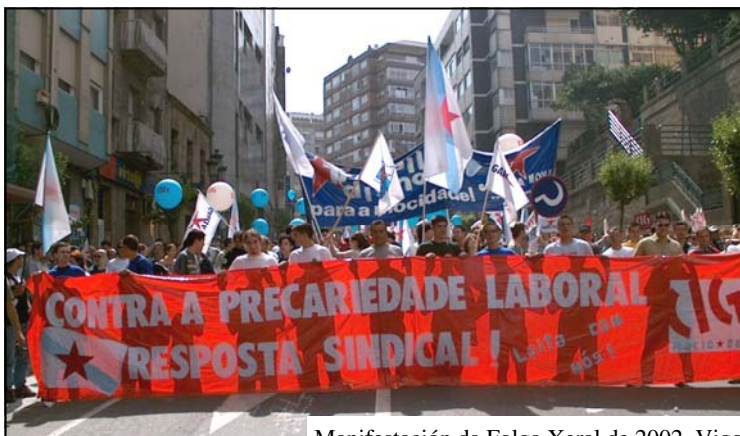
Manifestación da Folga Xeral de 2002, Vigo