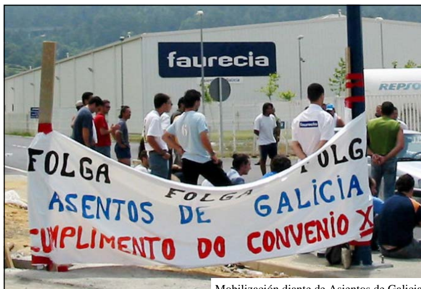
Mobilización diante de Asientos de Galicia

Dúas semanas despois da sinatura do Convenio a Dirección de ADG volve aumentar unilateralmente a produtividade.