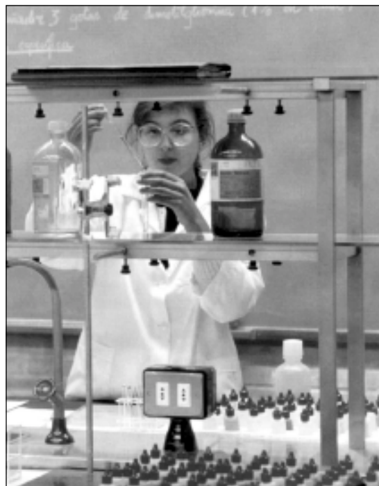
É necesario aumentar os fondos dedicados á investigación.

rural. A escasez de postos de traballo para mulleres, xunto á falla case absoluta de servizos sociais que lles permitan optar aos poucos existentes, é unha das causas principais do despoboamento do rural. Cómpre, xa que logo, unha aposta pública –o sector privado xa está demostrado que non é capaz ou non lle interesa–, forte e rápida, mediante investimentos produtivos importantes e creación de servizos sociais se se quere paliar esta situación e frear así a desertización do rural galego.