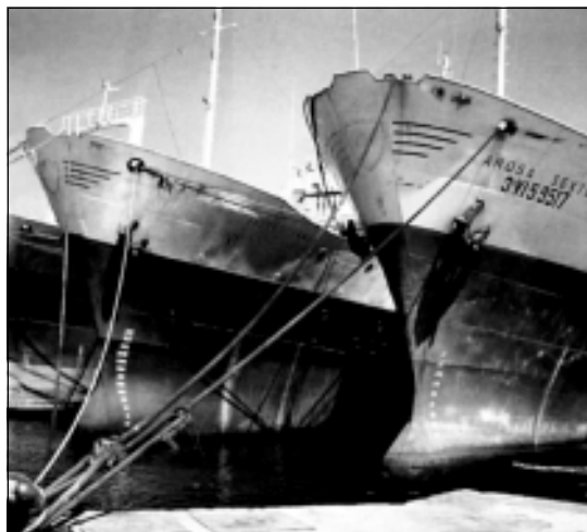
A pesca é unha das actividades básicas da economía galega e a única que completa no país o seu proceso produtivo.