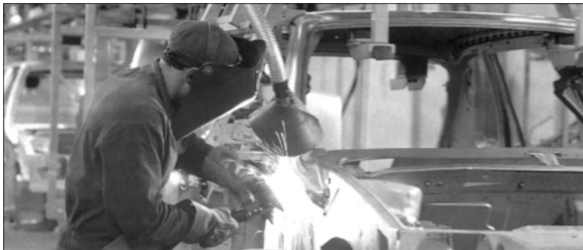
A precariedade non é a mesma en todos os sectores, nuns prima a eventualidade, noutros as excesivas horas extras...

Para avanzarmos neste sentido, cómpre tamén que mudemos os nosos métodos de traballo. Temos que pular pola participación activa, consciente e plena, dos afectados/as pola negociación de calquera convenio, calquera que sexa a súa dimensión e ámbito. Resulta difícil organizar un sector se todos os afectados descoñecen o potencial que representan, se antes nunca se axuntaron entre varias empresas ou nunca asistiron a unha asemblea xeral do seu colectivo. Velaí o noso deber sindical.