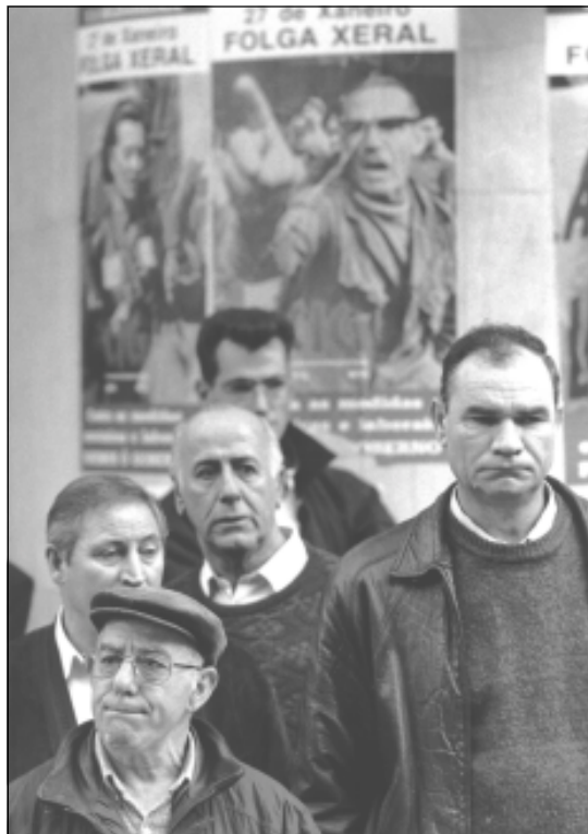
A globalización e as políticas neoliberais aumentan a desregulación laboral e a rebaixa ou perda de servizos básicos.

As seguintes análises e medidas a levar adiante a curto e medio prazo están enmarcadas na análise anterior, e polo tanto vencelladas a un proxecto global, transformador, solidario, democrático e de soberanía.