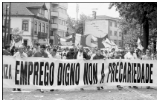
Un 50% dos asalariados galegos están hoxe en situación precaria.

Sumando os apartados 2), 3) e 4) vese que os traballadores/as en situación de precariedade laboral representan, aproximadamente, sobre o 50% dos/as asalariado/as galegos/as.