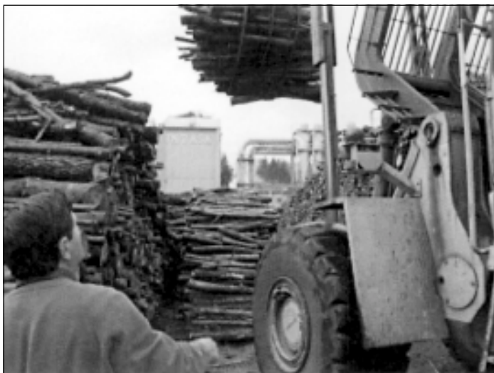
Compre explotar racionalmente o monte, reforestar as zonas calvas (especialmente con especies autóctonas) e proveitar o mato para coxeración de enerxía e calor.